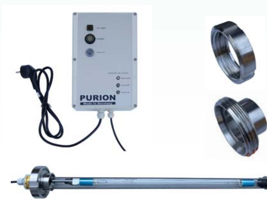
Bild: PURION weld in UV-Set 48 W & optional mit Splitterschutz

...zeichnet sich durch eine außerordentlich hohe Desinfektionsleistung bei kompakter Bauweise und geringem Energieverbrauch aus. Es ist nach geltenden Gesetzen, Normen und Richtlinien ausgeführt.